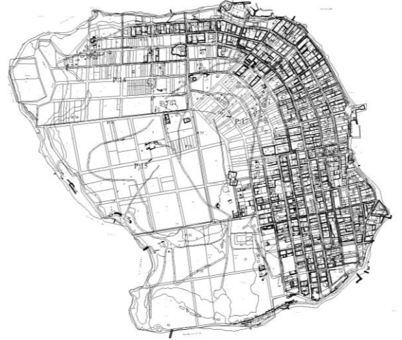
Şekil 1 Kınalıada Planı

Proje alanı; Kınalıada (Bölüm tarafından belirlenecektir.)