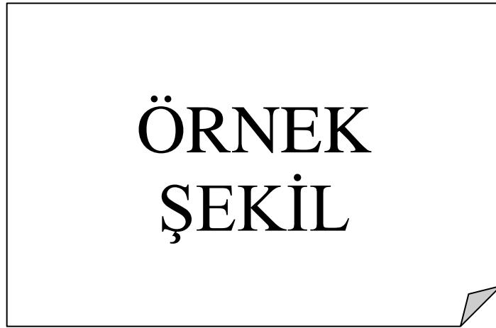
Şekil 3.1 : Sınır Hücresi