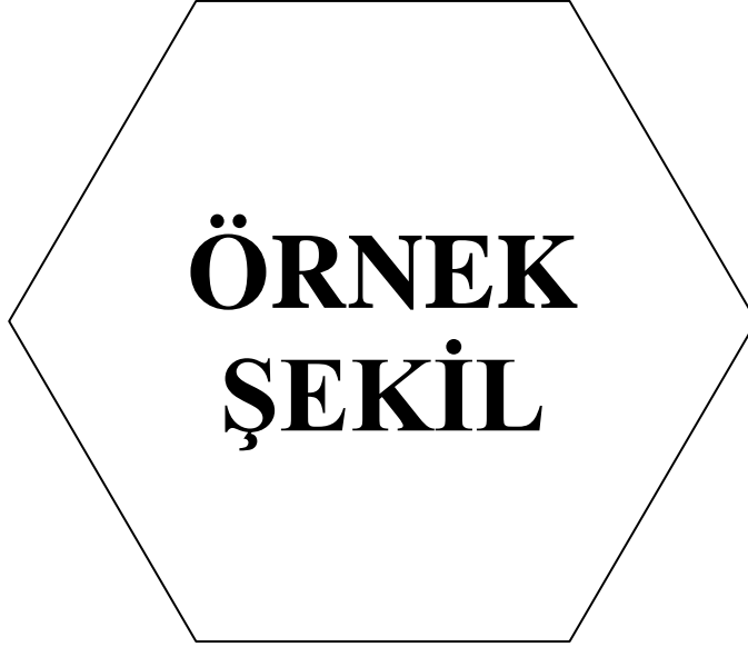
Şekil 4.1 : Örnek Şekil

Stet clita kasd gub rgren, no sea takimata sanctus est Lorem ipsum dolor sit amet, consetetur sadipscing elitr, sed diam nonumy eirmod tempor invidunt ut lab ore sit et dolore magna.