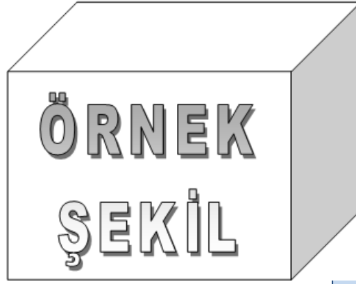
Şekil 1.1 : Model Yapıları [1]

diam nonumy eirmod tempor invidunt ut lab ore sit et dolore magna. Stet clita kasd gub rgren, no sea takimata sanctus est.