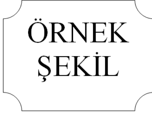
Şekil 5.1 : Beşinci Bölümde Örnek Şekil

This indicates that the ANN is accurate at base flow and flow height values lower than 3 m.