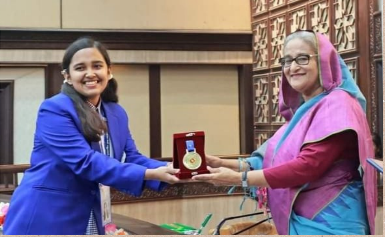
'Gündem Güney Asya' Podcastının ilk bölümünün konuğu Queen, Bangladeş'in Başbakanı Sheikh Hasina'dan Ulusal Yetenek Ödülü alıyor.