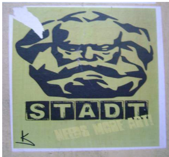
Figure 7. Anonymous poster on the wall, Chemntiz, photography by author.

When I raised questions to interviewees about the meaning of the monument the answers were not identifying with the symbol but they were thinking that it should remain there: