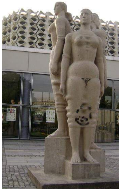
Figure 2. Paint on sculpture, Chemnitz

This stance adopted by the founders of the memorial structures rendering the public into audience bring being a stranger closer to the alienation of the local inhabitant from the space s/he produces. Yet, since the constructed space is not united but divided both by the different regulations and different stances taken by different groups; it is impossible for the structure to keep the initial meaning attributed to it. Yet, the domination of memorial structures on the public space leads the researcher to be more careful when deciphering the rather hidden language of power. Since “the social space is a social product” (Lefebvre 2009, p. 34), it is not possible that the hegemony could leave it untouched. Even though the appropriation of space is dependent on a process to be self-representative, due to the interaction between the “conceived, perceived and lived spaces”; the space is composed of spatial practice (the deciphering of the space by the society), the “representations of space” (the planned and organized space) and the “representational spaces” (the space experienced via the specific use of symbols and images) (Lefebvre, 1990, pp. 34-39).