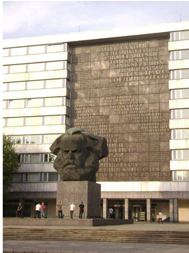
Figure 1. Karl Marx monument by Lev Kerbel, photography by author