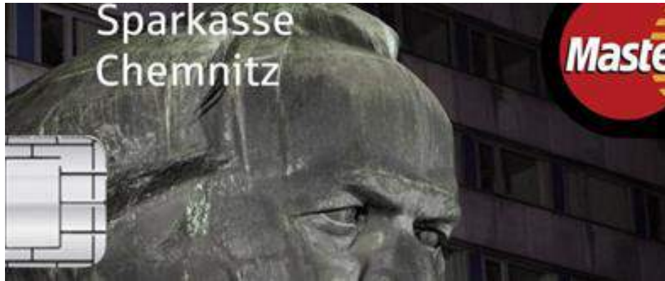
Figure 6. Credit card print from Sparkasse, Chemnitz