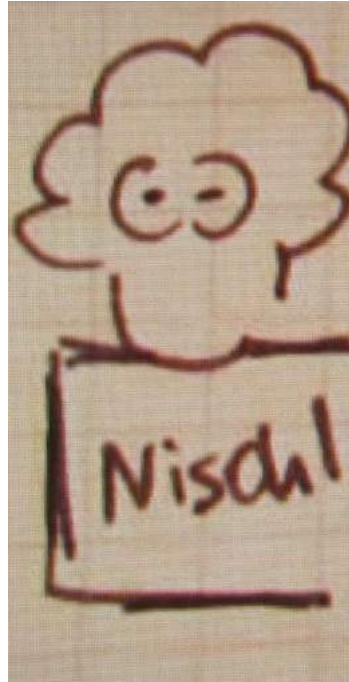
Figure 5. Part from the sketch map of K.A.

In present culture this symbolism is very much faded out as symbolized in the change of the Karl Marx monument from the signifier of socialist architecture to a local “Nischel” who is more of a local from the city. The city is also called “Stadt mit Köpfchen” (City with the Little Head) referring the Karl Marx bust (Welt, 2001).