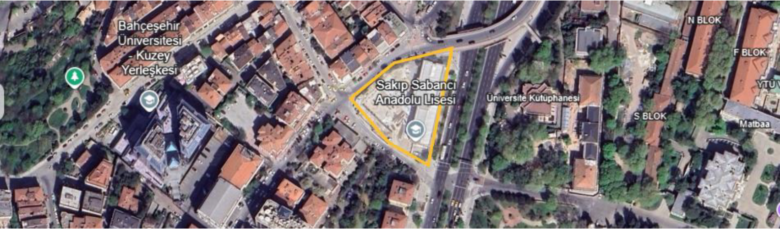
Sakıp Sabancı Lisesi 4000 m 2