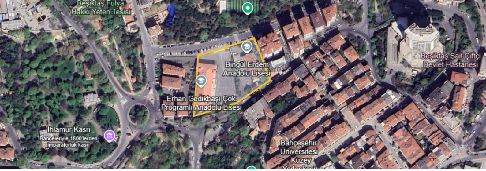
Erhan Gedikbaşı Çok Programlı Anadolu Lisesi, Bingül Erdem Anadolu Lisesi 7000 m 2