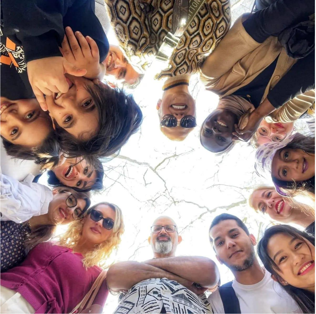
İGÜN-TÖMER Öğrencileri ile Biz Kocaman Bir Aileyiz...