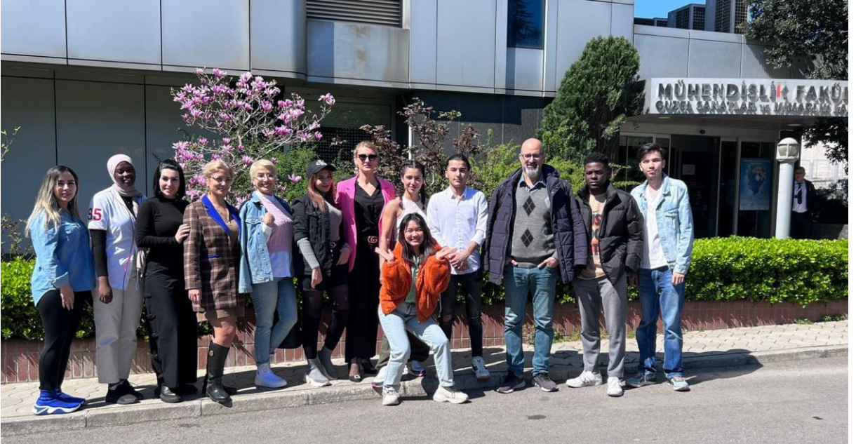
B2 SINIFI ÖĞRENCİLERİMİZLE..