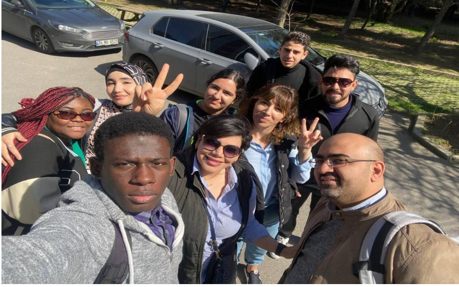
İGÜN-TÖMER Öğrencileri ile Lunapark Gezisi