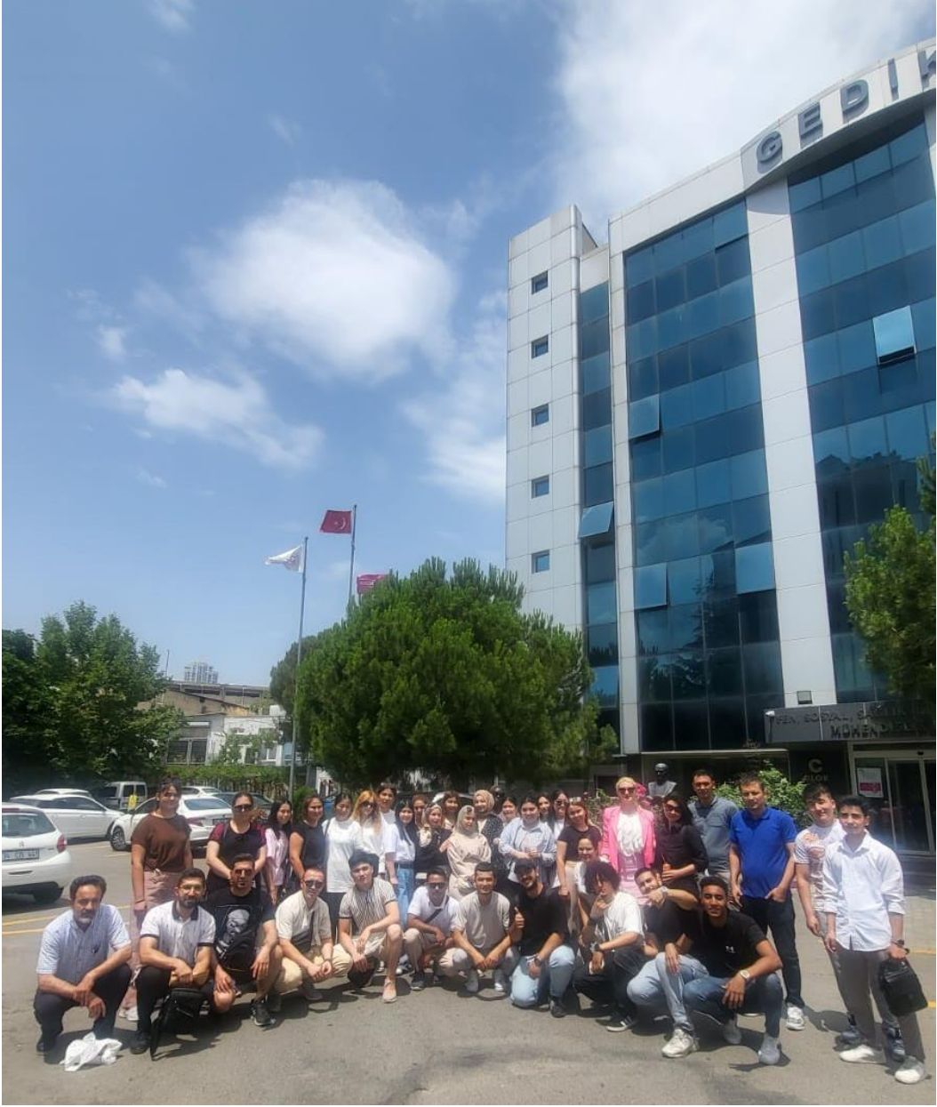
İGÜN-TÖMER ÖĞRENCİLERİMİZLE SINAVDAN SONRA KEYİFLİ BİR GÜN GEÇİRDİK.