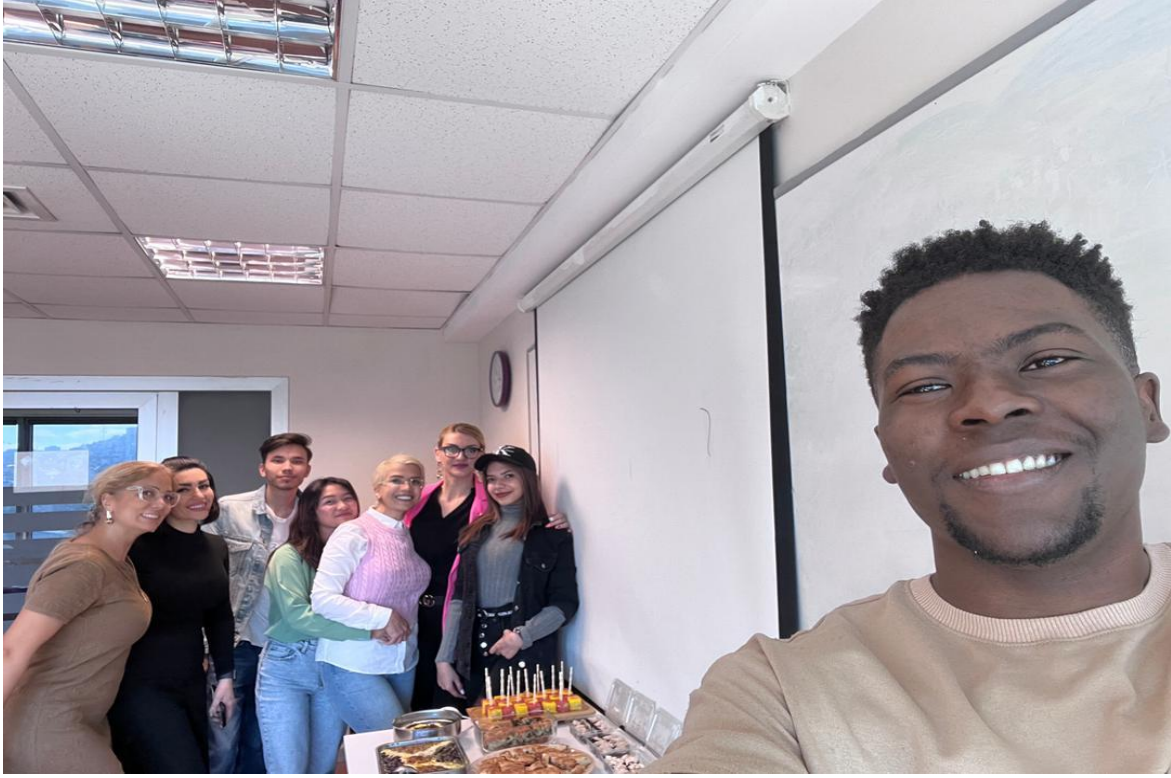
İGÜN-TÖMER ÖĞRENCİLERİ İLE DERSİN SONUNDA DOĞUM GÜNÜ KUTLAMASI YAPILDI