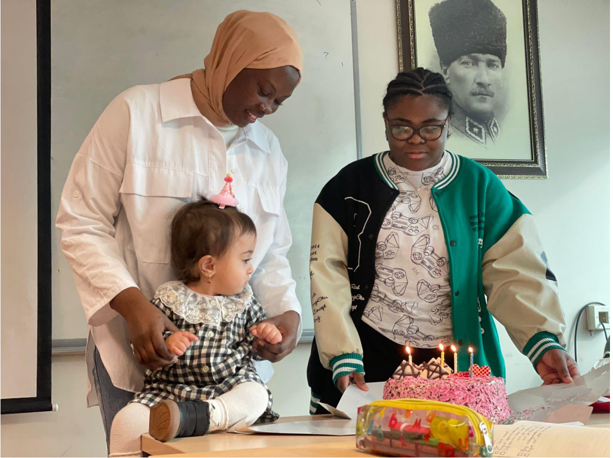
DERSİMİZİN EN KÜÇÜK KATILIMCISI...