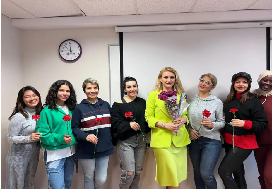
8 Mart Dünya Kadınlar Günü