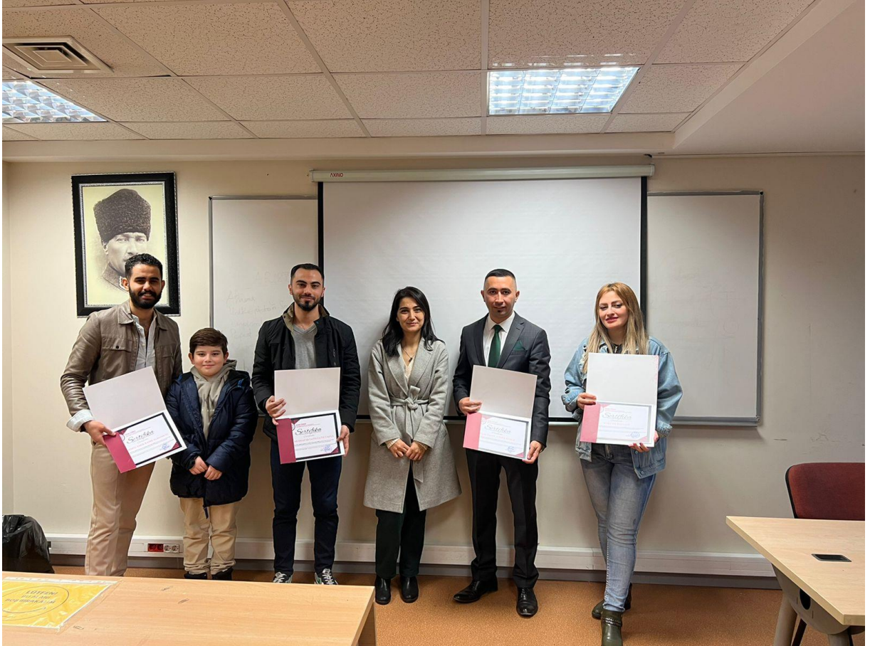
Kuru Başarıyla Bitiren Öğrencilerimize Sertifikaları Verildi