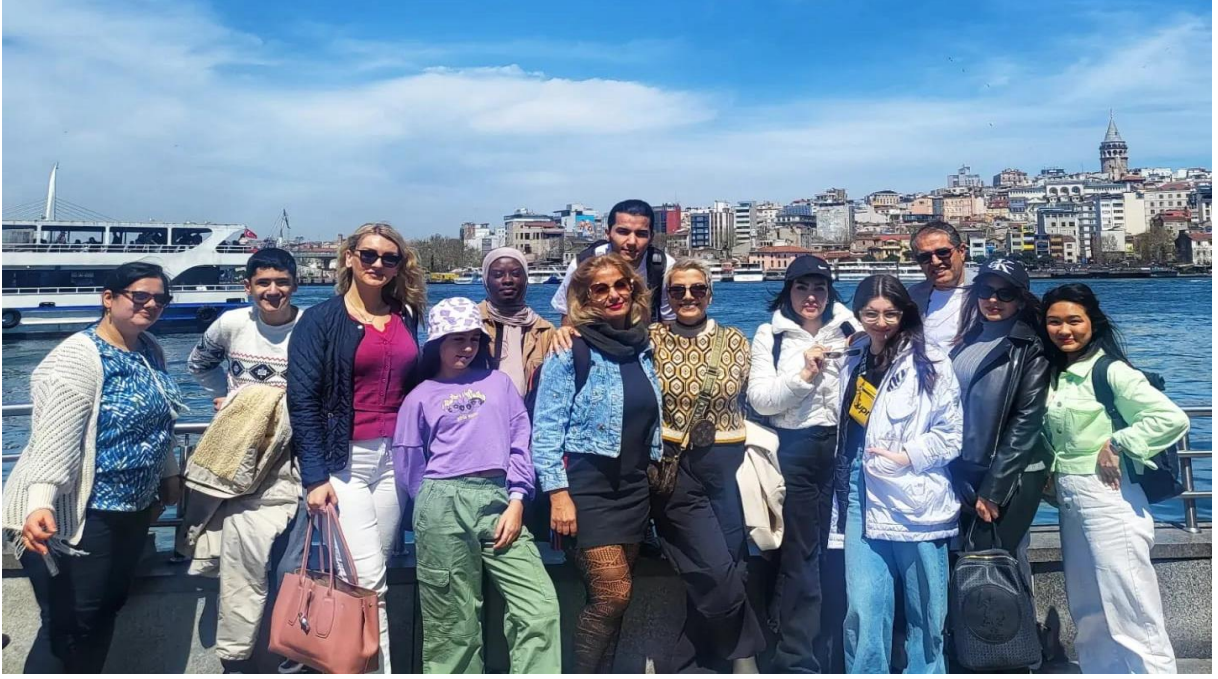
İGÜN-TÖMER Öğrencileri ile İstanbul Gezisi için Toplandık