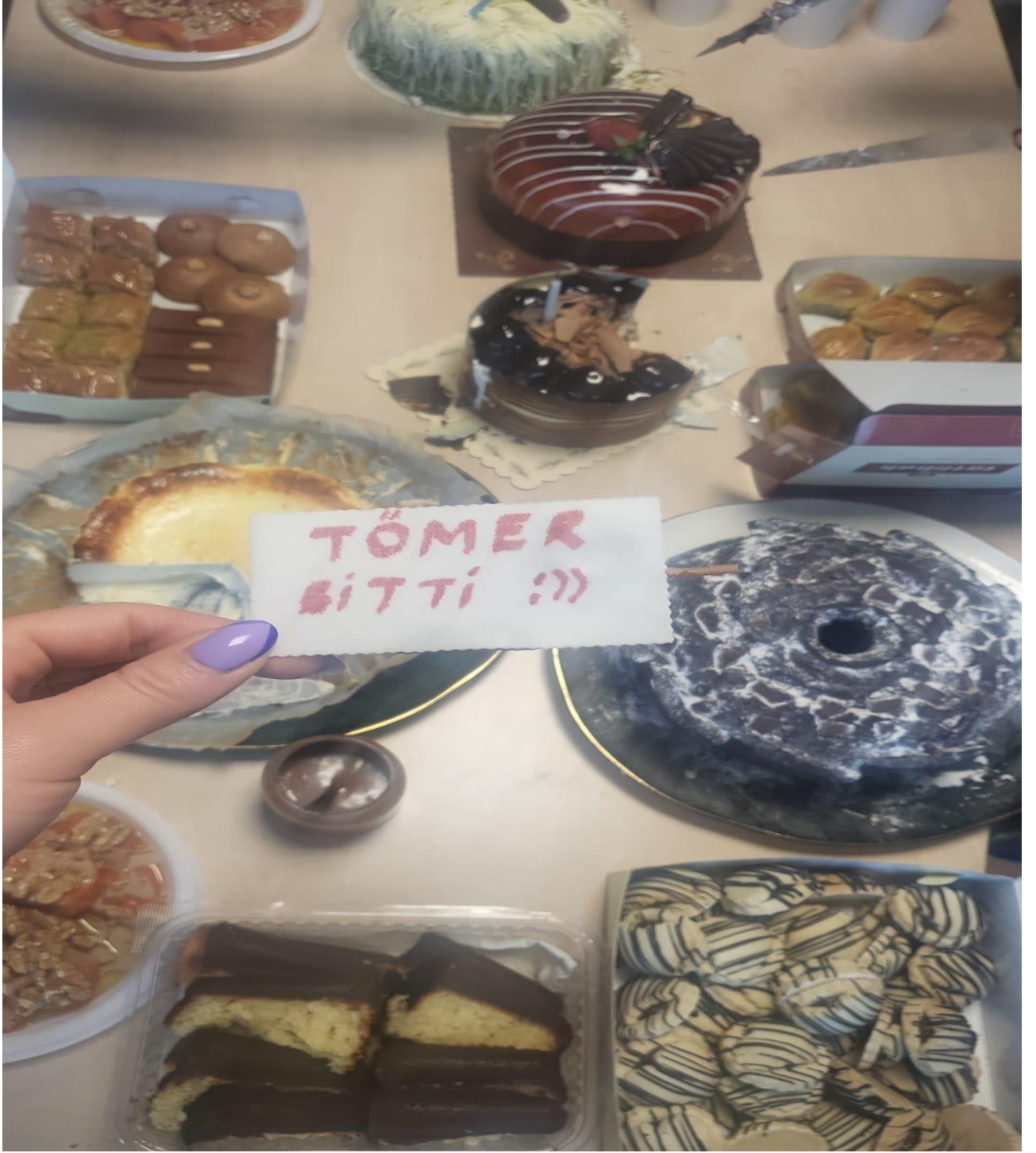
TÖMER DERSLERİMİZİN BİTİŞİ