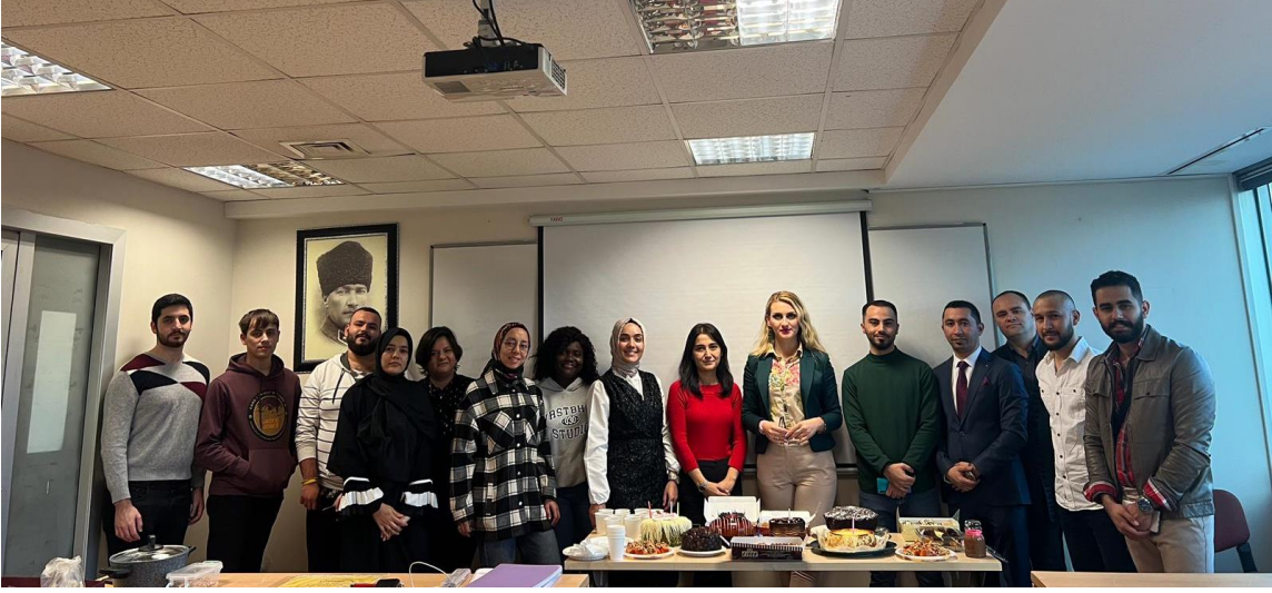
ÖĞRENCİLERİMİZ İLE BİRLİKTE DOĞUM GÜNÜ KUTLAMASI YAPTIK.