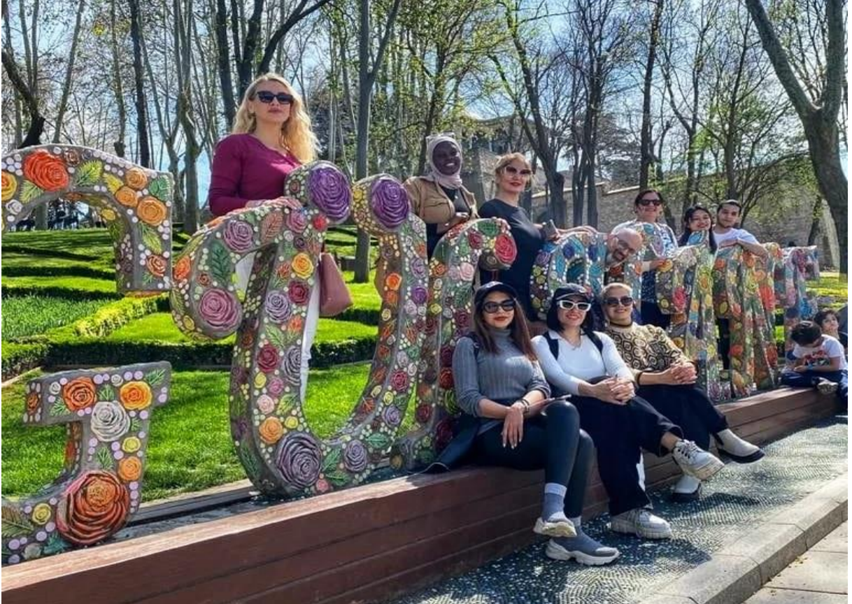
İGÜN-TÖMER Öğrencileri ile Gülhane Parkını Gezdik