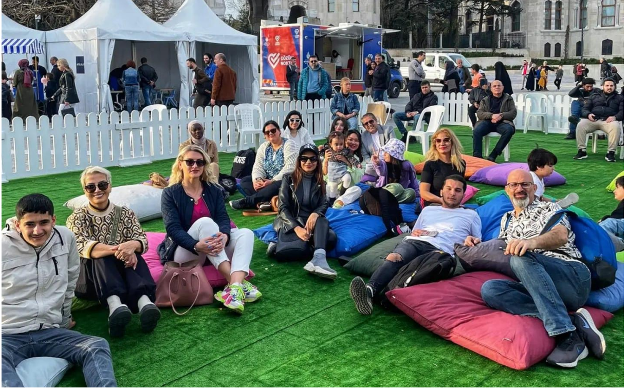
ÖĞRENCİLERİMİZLE İSTANBUL GEZİSİ YAPTIK.