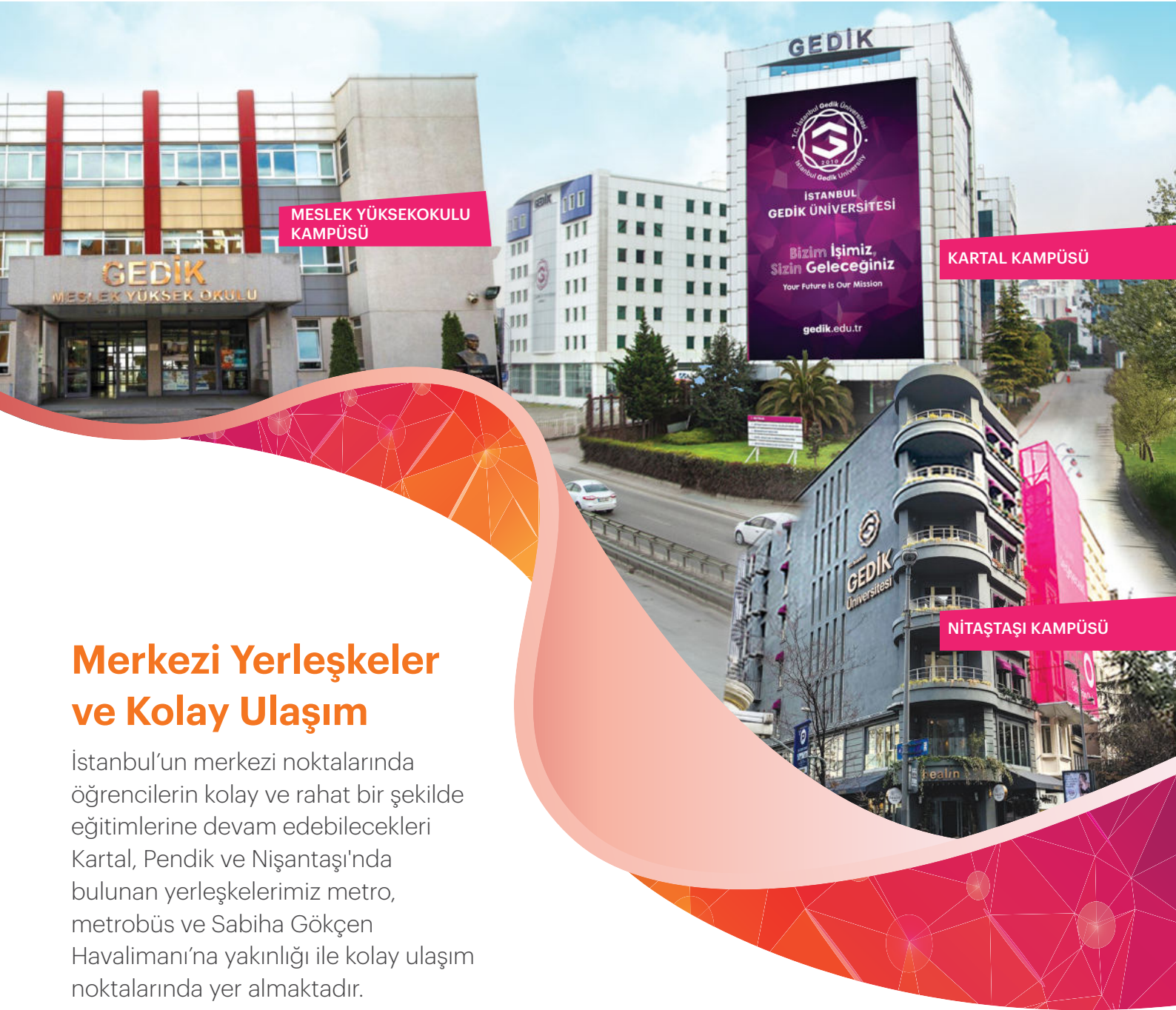
MESLEK YÜKSEKOKULU KAMPÜSÜ